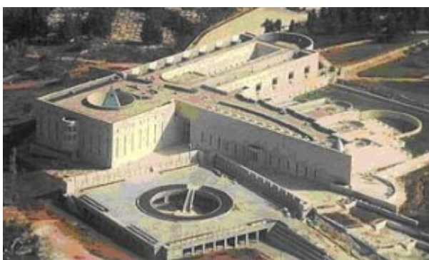
Tribunale di Gerusalemme

Articolo di Corrado Belli - www.mentereale.com