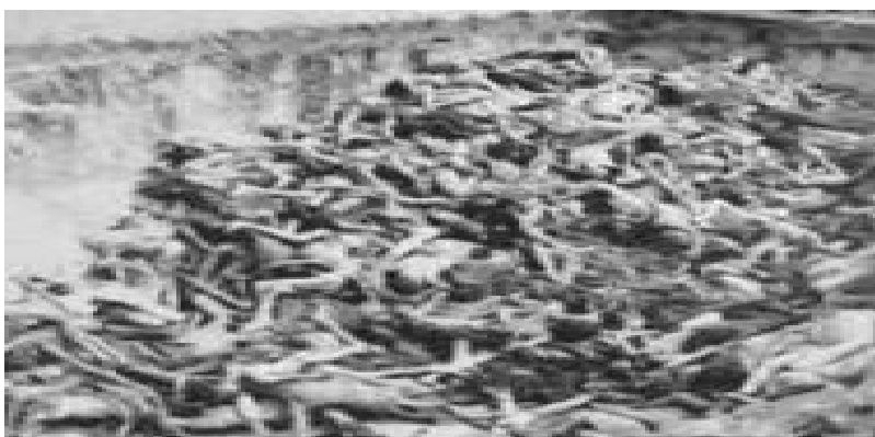
Final solution - GULAG - 100 MILLION Russians and other Slavs EXTERMINATED

Durante l’anno 1937, il Comitato Centrale Comunista, decise che la popolazione russa doveva essere soppressa ancora di più. Si ordinò al NKVD che sterminasse un numero di 268,950 persone. I dirigenti allora conclusero che il ritmo del massacro era troppo lento; è cosicché la quota di morti s’incrementò a 48.000 persone.